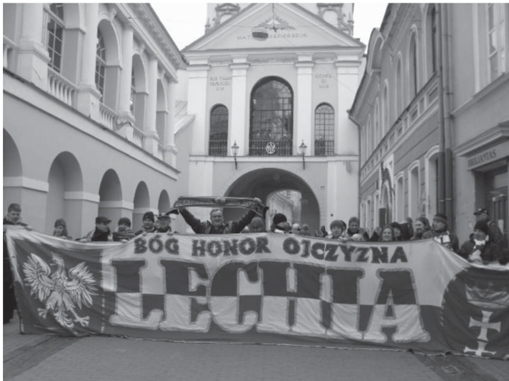
Lechiści podczas wizyty w Wilnie

Po wizycie postanowiliśmy, że właśnie polskie dzieci z Litwy, jak mało, kto, zasługują na ciekawe wakacje. Do Gdańska przyjadą dzieci, które nigdy jeszcze nie były w Polsce. Chcemy żeby zapamiętały Polskę najlepiej, dlatego zwracamy się do wszystkich kibiców, którzy mogą pomóc: rzeczowo, organizacyjnie lub finansowo o pomoc przy organizacji pobytu. Prosimy o wsparcie przy zapewnieniu ciekawego programu, jeżeli ktoś może zapewnić dla kilkunastu osób darmowe wejściówki np. do ogrodu zoologicznego lub smaczny obiad to niech da znać Lwom Północy na adres info@lwypolnocy.pl .