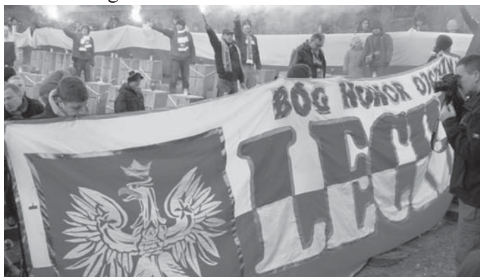
Lechiści podczas uroczystości na Rossie.